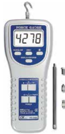
FORCE GAUGE , 5000 g Model: FG - 5005

Portable & Bench Type Physical Instrument