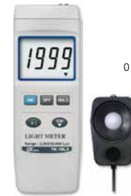
LIGHT METER Model: YK - 10LX