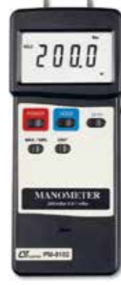
MANOMETER , 200 mbar Model: PM - 9102