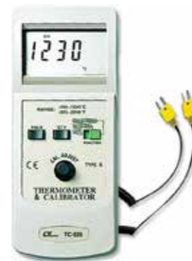
THERMOMETER CALIBRATOR Model: TC - 920