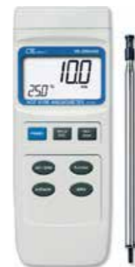
HOT WIRE ANEMOMETER + AIR FLOW Model: YK - 2004AH