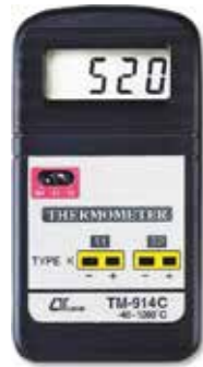
DUAL CHANNEL THERMOMETER Model: TM - 914C