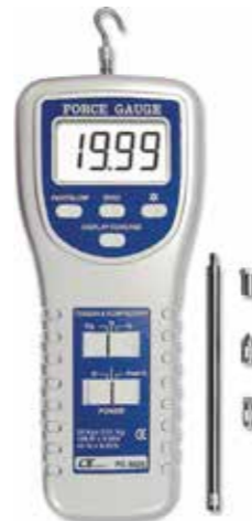
FORCE GAUGE , 20 kg Model: FG - 5020