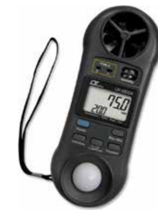
MULTI FUNCTION 4 in 1 Model: LM - 8000