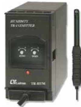
HUMIDITY TRANSMITTER Model: TR - HUM1A4 ترانسسمیتر رطوبت قابلیت اندازه گیری: 10 - 95% RH • خروجی: 4-20mA DC • تغذیه: 90-260 AC V