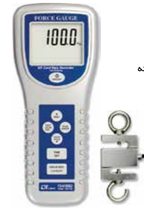
FORCE GAUGE , 100 kg Model: FG - 6100SD