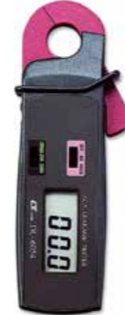
ACA LEAKAGE TESTER, AUTO RANGE Model: DL - 6054