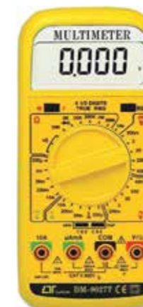
4 1/2 DIGITS DMM, True RMS Model: DM - 9027T