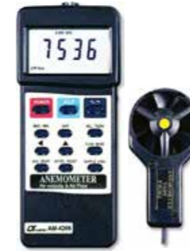
ANEMOMETER + AIR FLOW AIR VELOCITY Model: AM - 4206

Portable & Bench Type Physical Instrument