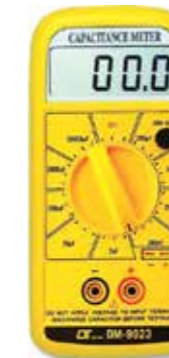
CAPACITANCE METER Model: DM - 9023