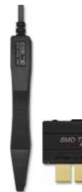
SMD TEST CLIP Model: SMD - 21