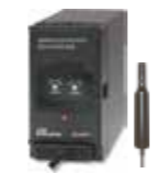
DISSOLVED OXYGEN TRANSMITTER