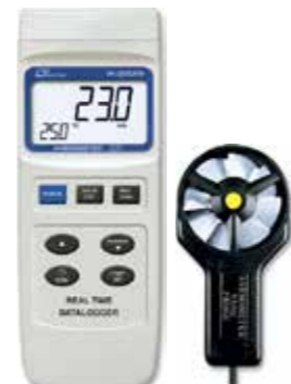
ANEMOMETER + AIR FLOW + TEMP REAL TIME DATA LOGGER Model: YK - 2005AM