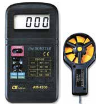
ANEMOMETER Model: AM - 4200