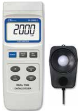
LIGHT METER REAL TIME DATA LOGGER Model: YK - 2005LX