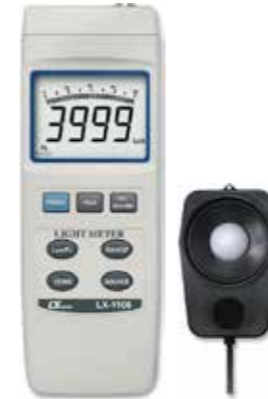
LIGHT METER , 4 LIGHT TYPE Model: LX - 1108