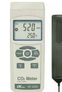
CO2 METER , TEMPERATURE Model: GC - 2028