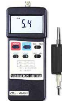
VIBRATION METER Model: VB - 8202