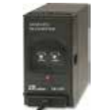
LOAD CELL TRANSMITTER