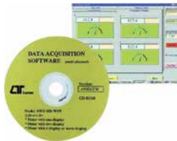
SOFTWARE FOR INTELLIGENT INSTRUMENTS Model: SW - U801 - WIN

قابل استفاده در دستگاه های کمپانی لوترون به جای کابل RS-232 جهت اتصال به PC