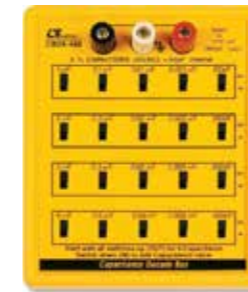
CAPACITANCE DECADE BOX Model: CBOX - 406