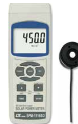
SOLAR POWER METER Model: SPM - 1116SD