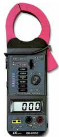
DCA/ACA CLAMP METER TEMPERATURE Model: DM - 6055C