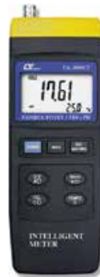
CONDUCTIVITY METER + PH METER Model: YK - 2001CT