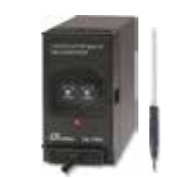
TEMP (TYPE K) TRANSMITTER