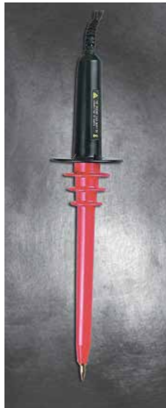
HIGH VOLTAGE PROBE Model: HV - 40