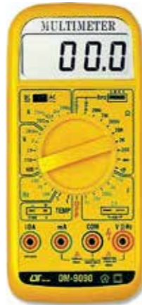
3 1/2 DIGITS DMM MULTI FUNCTIONS Model: DM - 9090