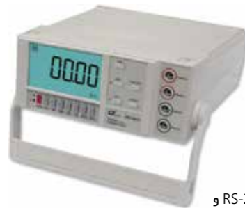
MILLIOHM METER HIGH PRECISION Model: MO - 2013