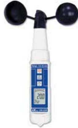
CUP ANEMOMETER Model: AM - 4220

Portable & Bench Type Physical Instrument