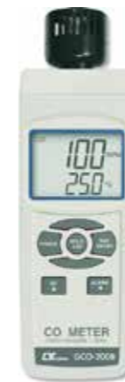
CO METER Model: GCO - 2008