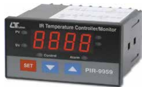
IR Temperature CONTROLLER/ MONITOR Model: PIR - 9959