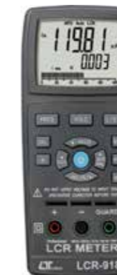
LCR METER, Professional Model: LCR - 9184