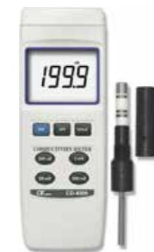
CONDUCTIVITY METER 4 ranges Model: CD - 4306