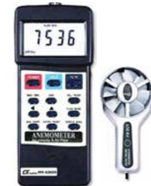
ANEMOMETER AIR FLOW AIR VELOCITY Model: AM - 4206M