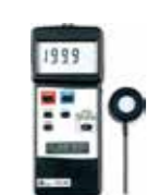
UV LIGHT METER