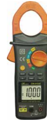
DCA/ACA CLAMP METER Smart 1,000A,+max,hold,+Temp Model: CM - 6155C