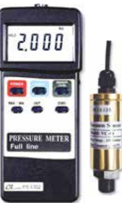
PRESSURE METER , FULL LINE Model: PS - 9302