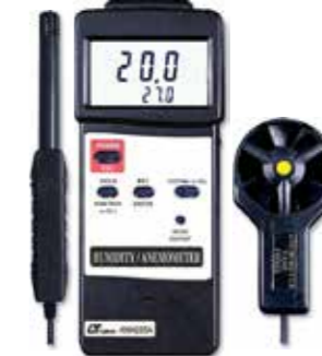
ANEMOMETER / HUMIDITY / TEMP TEMP 3 IN 1 Model: AM - 4205A