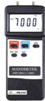
MANOMETER , 7000 mbar Model: PM - 9107