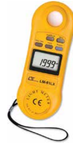
LIGHT METER Model: LM - 81LX