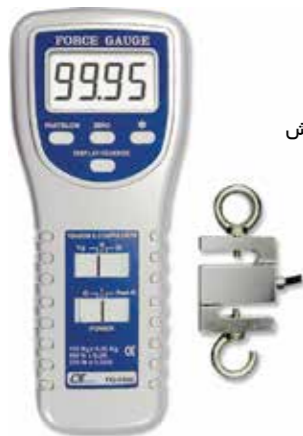
FORCE GAUGE , 100 kg Model: FG - 5100