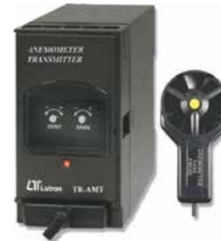
ANEMOMETER TRANSMITTER Model: TR - AMT1A4 ترانسسمیتر سرعت سنج باد قابلیت اندازه گیری: 0.4 ~ 30 m/s • خروجی: 4-20mA DC • تغذیه: 90-260 AC V