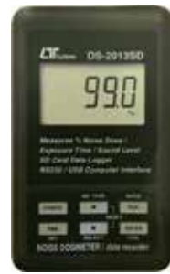
NOISE DOSIMETER (SD card data recorder) Model: DS - 2013SD

Portable & Bench Type Physical Instrument