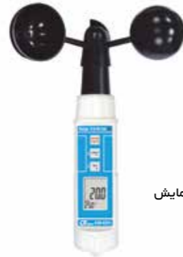
CUP ANEMOMETER Model: AM-4221