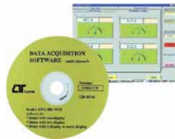
SOFTWARE FOR INTELLIGENT INSTRUMENTS Model: SW - 101 - WIN

• نرم افزار با قابلیت نمایش، رسم گراف و ذخیره اطلاعات • قابل نصب بر روی سیستم های عامل Win7 و XP و 2000 و Win98