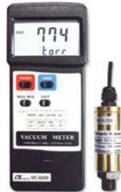
VACUUM METER Model: VC - 9200