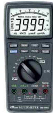
AUTO RANGE DMM GAT III 1000V Model: DM - 9960