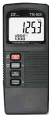
2 CHANNEL THERMOMETER DATA LOGGER Model: TM - 925