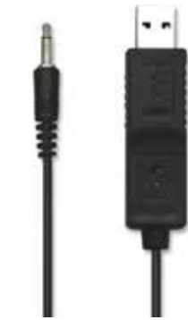
USB CABLE FOR INTELLIGENT INSTRUMENTS Model: USB - 01

کابل ارتباط دهنده PC و دستگاه اندازه گیری مربوطه