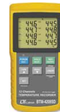
12 CHANNEL THERMOMETER REC Model: BTM - 4208SD