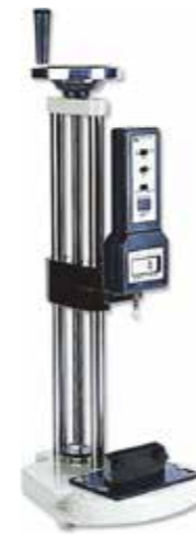
TEST STAND FOR FORCE GAUGE Model: FS - 1001