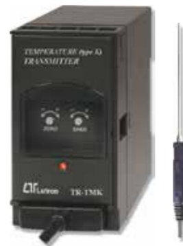
TEMP. (TYPE K) TRANSMITTER Model: TR - TMK1A4 ترانسسمیتر تیپ K دما قابلیت اندازه گیری: 0 ~ 500 C° • خروجی: 4-20mA DC • تغذیه: 90-260 AC V