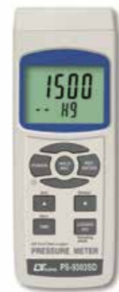
PRESSURE METER, FULL LINE Model: PS - 9303SD