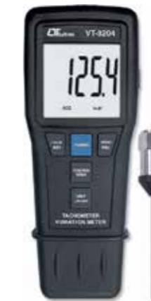
VIBRATION + TACHOMETER DATA LOGGER , 3 in 1 Model: VT - 8204