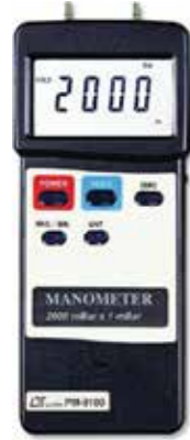
MANOMETER , 2000 mbar Model: PM - 9100

Portable & Bench Type Physical Instrument