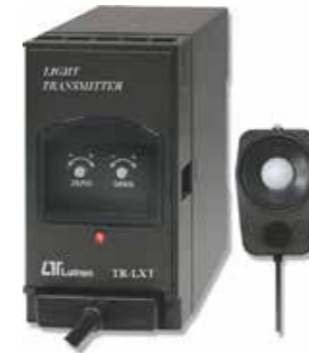
LIGHT TRANSMITTER Model: TR - LXT1A4 ترانسسمیتر لوکس ( روشنائی ) قابلیت اندازه گیری: 2000 / 20.000/ 50.000 LUX • خروجی: 4-20mA DC • تغذیه: 90-260 AC V