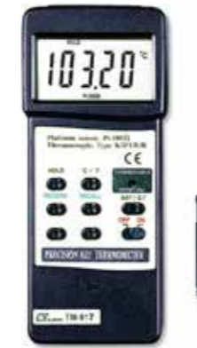
PRECISION 0.01 THERMOMETER Model: TM - 917