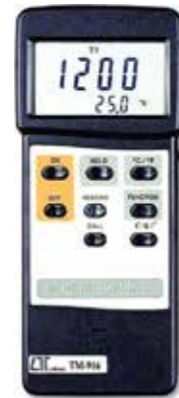
DUAL THERMOMETER Model: TM - 916