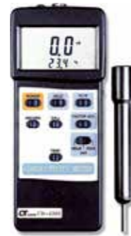
CONDUCTIVITY METER Model: CD - 4303