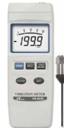
VIBRATION METER + DATA LOGGER Model: VB - 8203