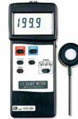
UV LIGHT METER-short wave 254 nm Model: UVC - 254