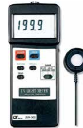
UVA LIGHT METER-long wave 365 nm Model: UVA - 365A