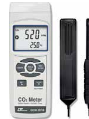
CO2 METER / HUMIDITY / TEMP. Model: GCH - 2018