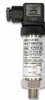
2 WIRES PRESSURE TRANSMITTER Model: TR - PS2W-XXbar ترانسسمیتر دو سیمه فشار قابلیت اندازه گیری: 0-2 / 5 / 10 / 20 / 50 / 100 / 400 bar • خروجی: 4-20mA DC • تغذیه: 9-30 DC V