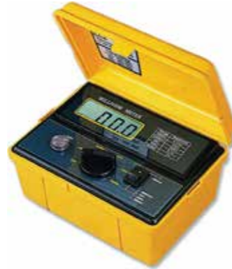
MILLIOHM METER Model: MO - 2001