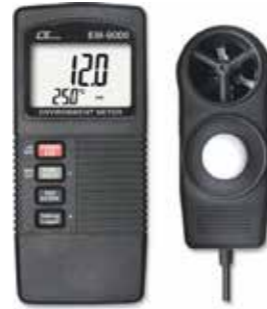
MULTI FUNCTION 4 in 1 Model: EM - 9000