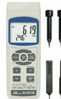
AIR QUALITY METER O 2 / CO 2 / HUMIDITY DEWPOINT / WET BULB Model: AQ - 9901SD