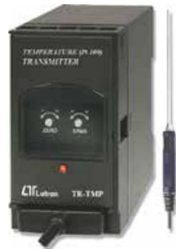
TEMP. (PT 100 OHM) TRANSMITTER Model: TR - TMP1A4 ترانسسمیتر دما (PT100) قابلیت اندازه گیری: -100 ~ +400 C° • خروجی: 4-20mA DC • تغذیه: 90-260 AC V