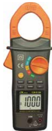
DCA/ACA CLAMP METER Smart 1,000A,+max,hold Model: CM - 6156