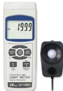
LIGHT METER Model: LX - 1128SD