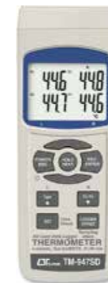
4 CHANNEL THERMOMETER Model: TM - 947SD