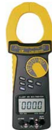
200 A DCA/ACA CLAMP METER+DMM Computer interface, True RMS Model: CM - 9930R