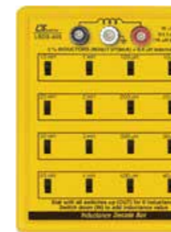
INDUCTANCE DECADE BOX Model: LBOX - 405