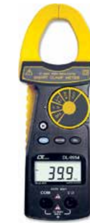
ACA LEAKAGE TESTER, AUTO RANGE True RMS Model: DL - 9954