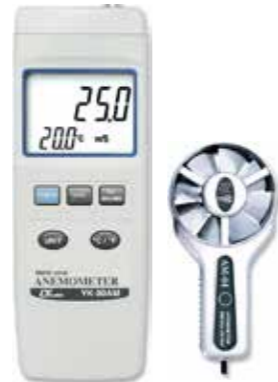
ANEMOMETER ( METAL VANE ) Model: YK - 80AM