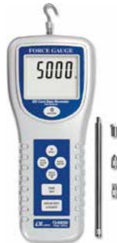
FORCE GAUGE , 5000 g Model: FG - 6005SD