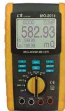
MILLIOHM METER 10 Amperes max. test current Model: MO - 2014