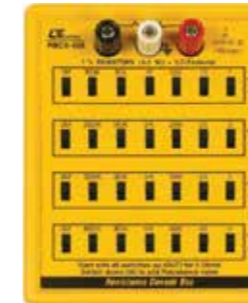
RESISTANCE DECADE BOX Model: RBOX - 408