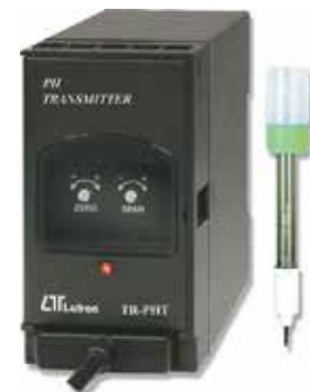
PH TRANSMITTER Model: TR - PHT1A4

ترانسمیتر لرزش و ارتعاش قابلیت اندازه گیری: • سرعت: 0.5 ~ 200 mm / S • شتاب: 0.5 ~ 200 m / S 2 • خروجی: 4-20 mA DC • تغذیه: 90-260 AC V