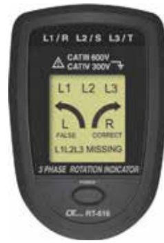
3 PHASE ROTATION TESTER Model: RT - 616

Electrical & Electronical Instrument ( For Electrical Engineering )