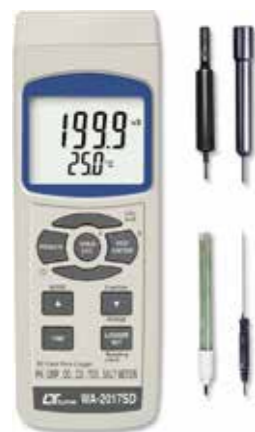
MULTIFUNCTION Model: WA - 2017SD