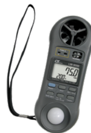
MULTI FUNCTION 7 in 1 Model: LM-9000