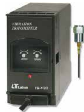
VIBRATION TRANSMITTER Model: TR - VBT1A4

ترانسمیتر صوت قابلیت اندازه گیری: 30 ~ 130 dB • خروجی: 4-20mA DC • تغذیه: 90-260 AC V