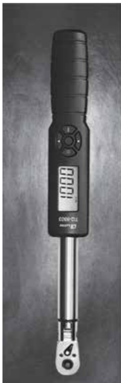
TORQUE WRENCH, 1000 kg f-cm Model: TQ - 8803