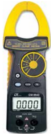
MINI DCA/ACA CLAMP METER Model: CM - 9940

Electrical & Electronical Instrument ( For Electrical Engineering )