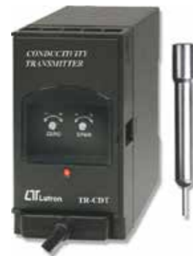
CONDUCTIVITY TRANSMITTER Model: TR - CDT1A4

ترانسمیتر PH قابلیت اندازه گیری: 0 ~ 14 PH • خروجی: 4-20 mA DC • تغذیه: 90-260 AC V