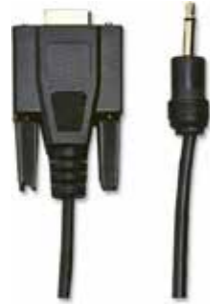
RS - 232 CABLE FOR INTELLIGENT INSTRUMENTS Model: UPCB - 01

کابل ارتباط دهنده PC و دستگاه اندازه گیری مربوطه