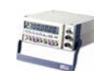
2.7 GHZ FREQUENCY COUNTER