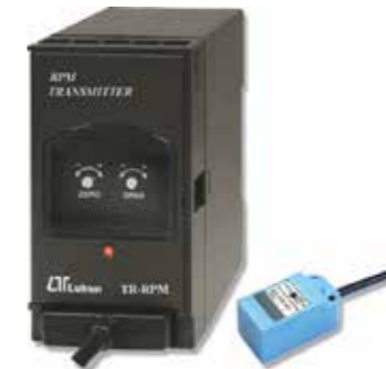
RPM TRANSMITTER Model: TR - RPM1A4 ترانسسمیتر سرعت قابلیت اندازه گیری: 100 ~ 2.000 RPM 1000 ~ 20.000 RPM • خروجی: 4-20mA DC • تغذیه: 90-260 AC V