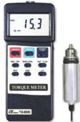
TORQUE METER , 15 kg. cm Model: TQ - 8800

Portable & Bench Type Physical Instrument