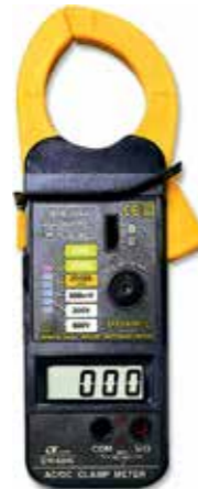
DCA/ACA CLAMP METER Model: DM - 6046