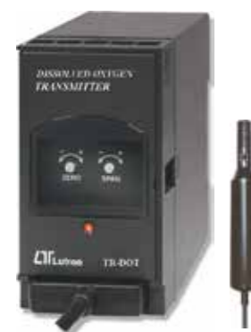
DISSOLVED OXYGEN TRANSMITTER Model: TR - DOT1A4

ترانسمیتر کندانکتیویته قابلیت اندازه گیری: • 200 us / 2 ms / 20 ms • خروجی: 4-20 mA DC • تغذیه: 90-260 AC V