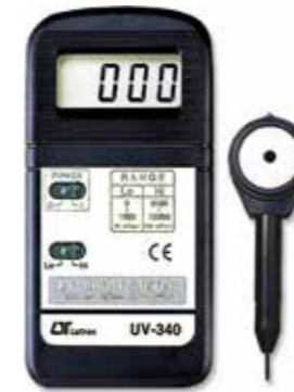
JV LIGHT METER-290 nm ~ 390 nm Model: UV - 340A