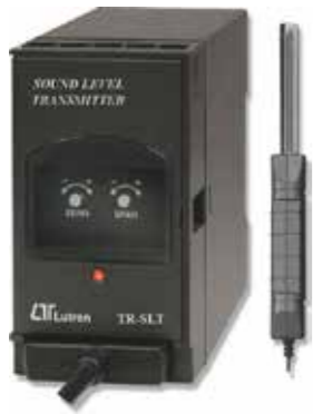
SOUND TRANSMITTER Model: TR - SLT1A4

ترانسمیتر صوت قابلیت اندازه گیری: 30 ~ 130 dB • خروجی: 4-20mA DC • تغذیه: 90-260 AC V