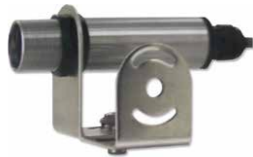
IR TEMP, TRANSMITTER 2wires, 4-20mA output, infrared, Temp. Model: TR - IR2W