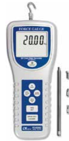
FORCE GAUGE , 20 kg Model: FG - 6020SD