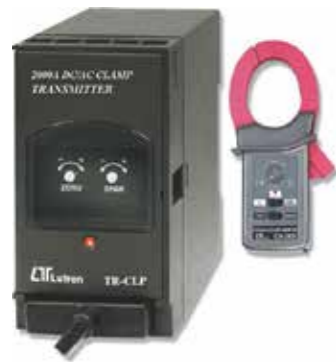
2000A DC/AC CLAMP TRANSMITTER Model: TR - CLP1A4 ترانسسمیتر جریان AC / DC قابلیت اندازه گیری: 0 - 200 / 2000 A (DC / AC) • خروجی: 4-20mA DC • تغذیه: 90-260 AC V