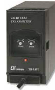
LOAD CELL TRANSMITTER Model: TR - LDT1A4 ترانسسمیتر وزن قابلیت اندازه گیری: 1 ~ 2 mV / V • خروجی: 4-20mA DC • تغذیه: 90-260 AC V