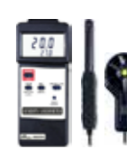
ANEMOMETER / HUMIDITY / TEMP