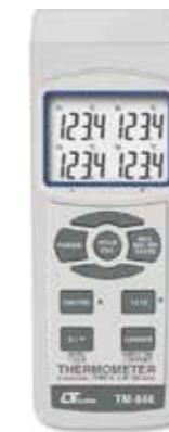
4 CHANNEL THERMOMETER Model: TM - 946